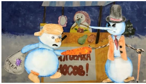
Рис.4 Кадр м/ф «Дуэль»