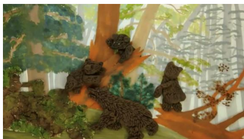
Рис.15 Кадр м/ф «Одумайтесь, люди!»

«Надежда» (по картине русского художника А. Рылова «В голубом просторе»), «Чёрный квадрат» по одноимённой картине К. Малевича) и «Ночь, когда сбываются мечты» (в основу лёг сюжет картины «Звёздная ночь» В. Ван Гога).