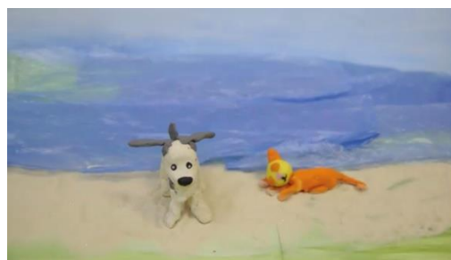
Рис.2 Кадр м/ф «Кошкин щенок»