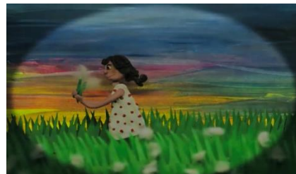
Рис. 12 «Невьянская башня» Рис. 13 Легенда о скале «Верблюд» Рис.14 «Партизанка Лара»

4. Изобразительное искусство и мультипликация. Работа над анимацией, создание персонажей и сцен требует от участников студии не только творческого подхода, но и знаний в области изобразительного искусства, композиции, цвета и т. д. Также у учащихся мультстудии был опыт «оживления» произведений искусства – в рамках участия в международном конкурсе «Аниматика», учащиеся сняли мультфильмы «Одумайтесь, люди!» (в основу легла картина русских живописцев И. Шишкина и К. Савицкого «Утро в сосновом лесу»),