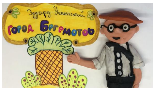
Рис.1 Кадр м/ф «Город бегемотов»

1. Литература. Учащиеся мультстудии активно используют литературные произведения в своей работе. Они создают мультфильмы, вдохновлённые стихами и рассказами, что помогает им глубже понять литературу и развить творческие способности. Например, в рамках проекта «Литература и мультипликация» были сняты мультфильмы «Кошкин щенок», «С фотоаппаратом», «Весёлый новый год», «Хитрые грибочки» по стихам Валентина Берестова, «Город бегемотов» по произведению Э.Успенского. Это яркий пример того, как школьная программа по литературе может быть интегрирована в процесс создания мультфильмов.