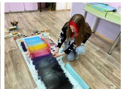
Рис.7,8 Работа над мультфильмом

Такие проекты не только развивают творческие навыки учащихся, но и помогают им лучше понять и полюбить литературу.