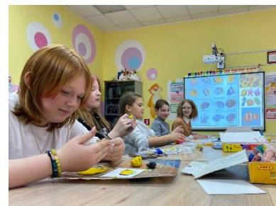
Рис.9 Кадр м/ф «Погружение в мировой океан мультфильмом