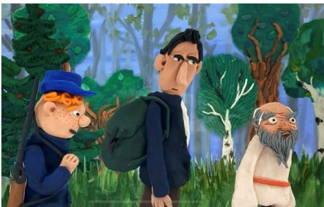
Рис.6 Кадр м/ф «Последний чёрт»

Проект «Акварельные краски» (2023–2024 гг.) — в этом проекте студией был экранизирован один из рассказов К. Г. Паустовского - «Последний чёрт». Съёмка двадцати мультфильмов по рассказам была приурочена к 130-летию писателя, которое отмечалось в 2022 году. Проект поддержали музей К. Г. Паустовского в Москве и Президентский Фонд Культурных Инициатив.