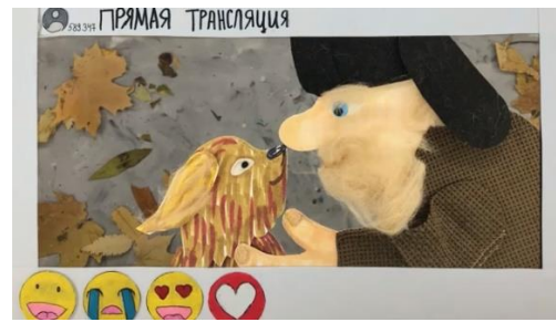
Рис.5 Кадр м/ф «Сколько всего