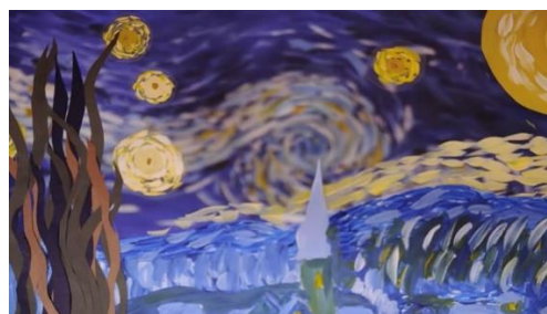
Рис. 16 Кадр м/ф «Ночь, когда сбываются мечты»